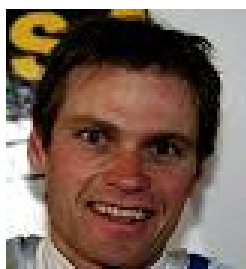
Andreas Widhölzl Copyright FIS