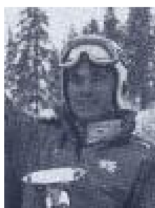
Andreas Felder