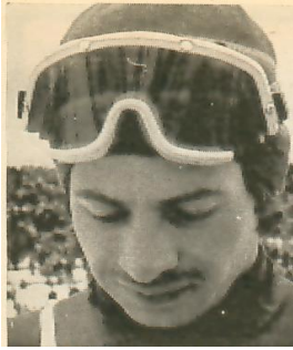
Karl Scanabl Copyright Lahti Hiihtomuseo

KANSAINVÄLINEN ERIKOISMÄENLASKU P 90 SKI-JUMPING P 90 LAHTI 2.3.1975