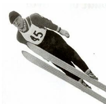
Veikko Kankkonen