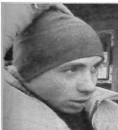
Aleksei Borovitin Copyright Lahti Hiihtomuseo