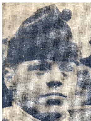
Veikko Kankkonen