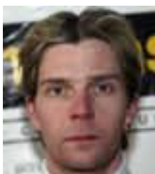
Janne Ahonen