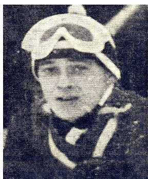
Niilo Halonen Copyright Lahti Hiihtomuseo