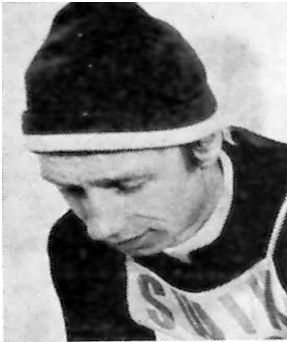
Walter Steiner Copyright Lahti Hiihtomuseo