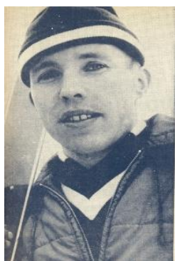
Juhani Kärkinen Copyright Lahti Hiihtomuseo