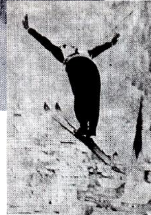
Paavo Nuotion tyylikästä lentoa.