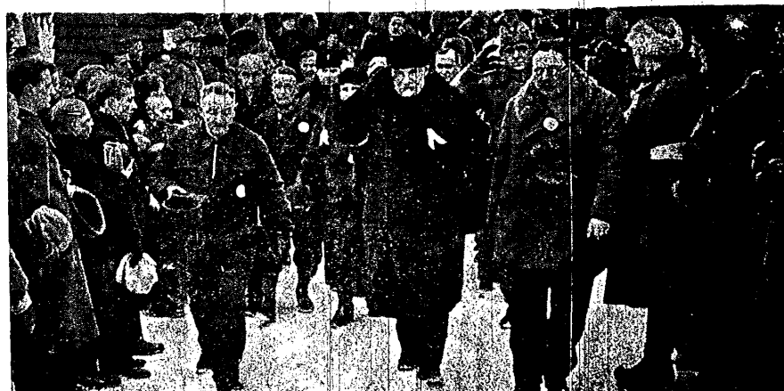
Presidentti Svinhufvud saapuu Salpausselälle Porilaisten marssin aikaan.